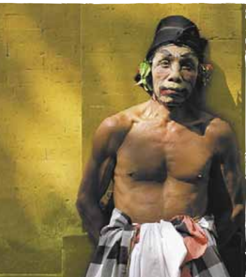
Danseur de barong au repos