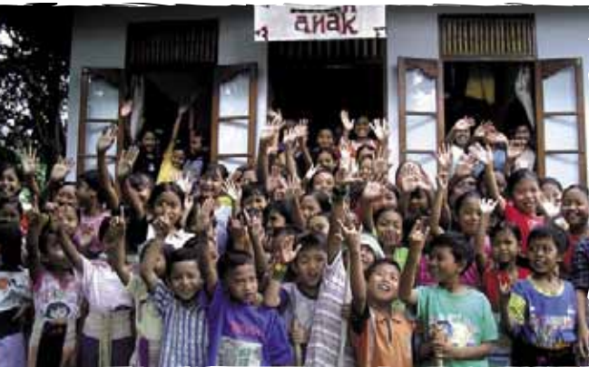
Enfants de la Fondation Métropoli