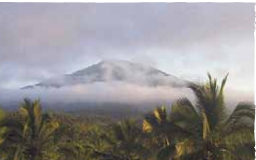
Le mont Batukura